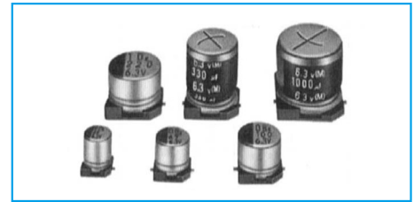
表示色: φ4×5.3L~φ8×6.5Lはケース頭部に黒色印刷 φ8×10L~φ10×10.5Lは茶色スリーブに白色印刷 φ12.5×13.5Lはケース頭部に黒色印刷